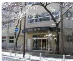
(中央地域振興センター内 3階一部)