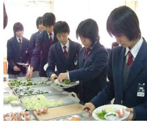
小学校や中学校での生活習慣病予防 に向けたモデル授業の風景