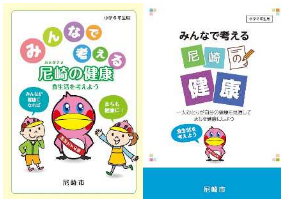
小学校 6 年生・中学校 2 年生対象の 学校教材副読本

全てのライフステージを網羅した生活習慣病予防に関する共通指針として策定した「尼崎市生活習慣病予防ガイドライン（平成 23 年 12 月）」を活用し、健康、教育、福祉、協働、産業経済など、分野を超えた組織横断的な連携による、健康寿命の延伸に向けた効果的な事業展開を行なう。これら事業は「ヘルスアップ尼崎戦略推進会議」で協議、評価、再構築する。 その一つとして、市独自に作成した学校教材副読本などを活用し、小 6、中 2 を対象にした授業を実施する。これらを通じ望ましい生活習慣の獲得を図る。