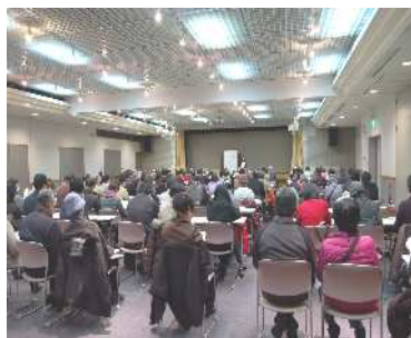
保健指導実施風景