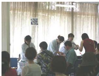
特定健診実施風景