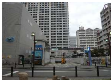
( 第二地区駐車場 )