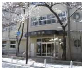
(中央地域振興センター内 3階一部)