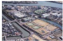
東部浄化センター