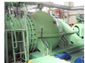
大庄中継ポンプ場 改築予定雨水ポンプ 供用開始：昭和43年