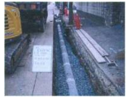
雨水浸透管建設工事