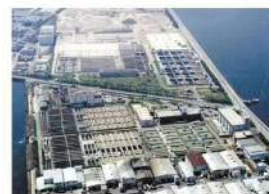
武庫川下流浄化センター