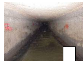
管きょ改築工事 (管更生工事)