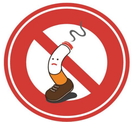
尼崎市の歩きたばこ抑制啓発キャラクター