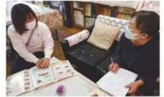
尼崎市立塚口幼稚園で お話を伺いました。

幼稚園で遊びを通して 学び、培った力が 小学校からの生活や学習の土台 となっていきます！