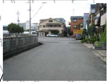
区域西側の「市道第 191 号線の乙」