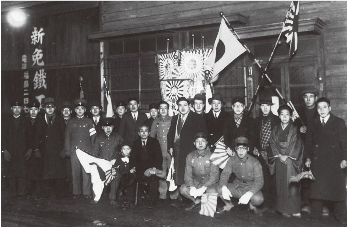
戦時中、工場前での集合写真