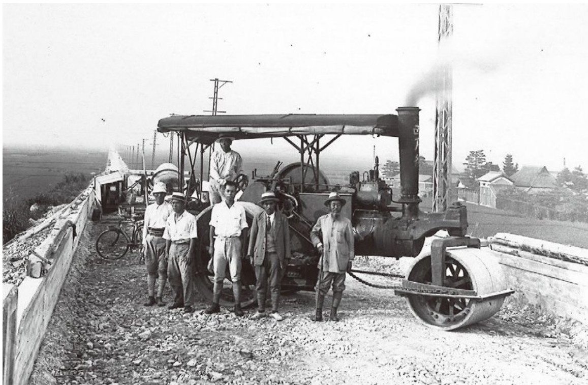
1932年9月 尼宝自動車専用道路建設時(現在の県道尼宝線)