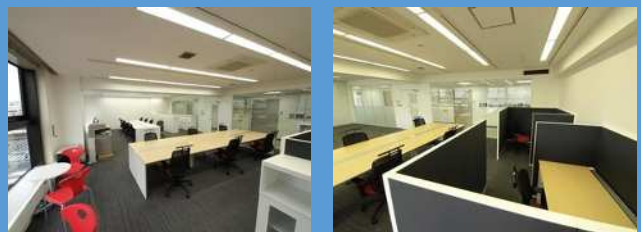
尼崎創業支援オフィス「ABiZ」

尼崎課題解決型ビジネスプランコンペ優勝者には、 尼崎市長賞と 尼崎創業支援オフィス「ABiZ」の利用権1年分!