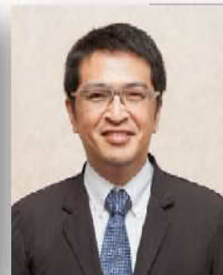
大阪市立大学准教授