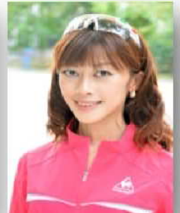
サイクルライフナビゲーター