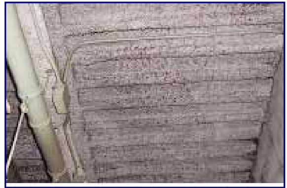
[柱・梁・天井などに吹付けられたアスベストの例]