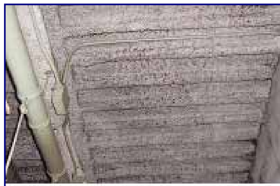
[柱・梁・天井などに吹付けられたアスベストの例]