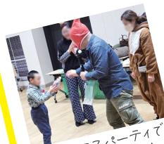
クリスマスパーティーで プレゼント交換★