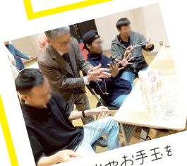
あやとりやお手玉を 楽しみました★