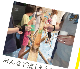
みんなで流しぞうめんか