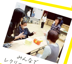
みんなで レクリエーション会