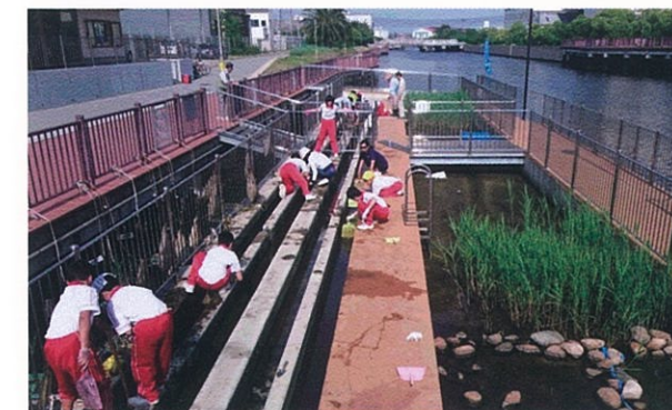
尼崎ネイチャークラブ

長年放置され、ゴミの不法投棄や外来種の繁茂による生物多様性の低下などが見られた佐璞丘の森を、クリーン作戦、シュロの伐採、多様なイベントの開催などで、地域コミュニティが集う、憩いの場にする活動を展開しています。参加主体は、地域団体、企業、学校、住民など多様で、イベント時は150～300人が参加する動員力があり、地域の関心の高さがうかがえます。森という自然資源を地域の財産として、保全と活用を両立しようとする活動は、新しい環境保全の取り組みとしても高く評価します。