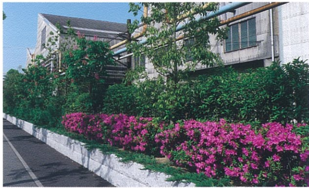
新日鐵住金株式会社 技術開発本部