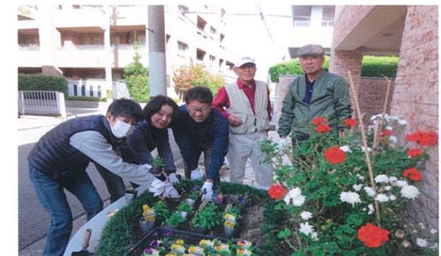
パレシェール武庫之荘管理組合 グリーンクラブ

尼崎市立成良中学校の活動を母体にして始まった、尼崎港と尼崎市南部北堀運河での水質浄化の活動は、現在では幼児から大人まで、また学生、市民、行政、専門家など様々な主体を巻き込み、地域の環境学習を牽引する先進的な活動となっています。水質の改善にとどまらず、わかめ栽培などの生物多様性保全、たい肥を使用した菜の花栽培や廃油のバイオディーゼル化など、「循環」の可能性を追求し、尼崎の新しい自然景観を創出するユニークな活動は秀逸です。