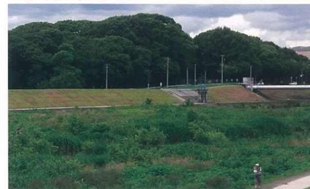
万葉の森・佐璞丘再生プロジェクト

阪急武庫之荘駅の南側にあるゴンドラ型の噴水は、つくられた当時は地元のシンボルとして親しまれていましたが、長年、手入れがなされず、近寄る人もない場所になっていました。これをよみがえらせるべく、噴水周辺の草抜きや花の植え替えの手伝い、駅前の清掃、噴水修復費用の募金活動などの美化・整備活動が続けられ、ふたたび地域の人たちの憩いの場として再生されています。尼崎の身近な景観資源を再発見し、みずから再生させ、維持しようとする活動として高く評価します。