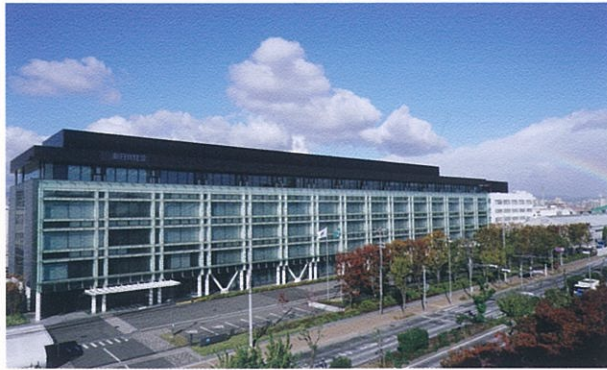
新日鐵住金株式会社 技術開発本部