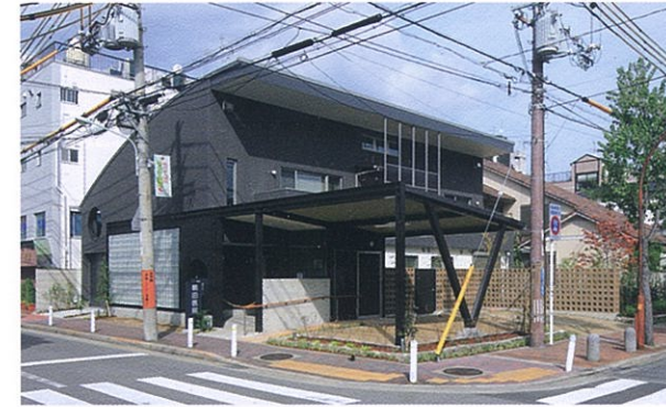
朝田医院・朝田邸

地域総合センターに隣接するまちかどに建っています。花をあしらった、小窓をもった木の塀が敷際におだやかな表情をあたえています。その塀と建物を含む全体が穏やかな色彩で整えられ、建物の角は大きく開口部が設けられて内部のようすがうかがえます。敷地のコーナー部分をあえて駐輪スペースとしていますが、そこから通園の人々や地域の人々の語らいの場としてにぎわいが生まれることに期待します。