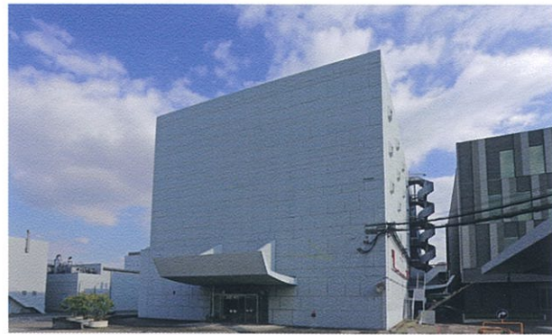
塩野義製薬株式会社 杭瀬事業所 倉庫・事務所

臨海工業地域で、五合橋線に沿った本社尼崎製造所の敷地際に、約1.2Kmにわたって、豊かに緑が連続しています。同社が平成19年より持続的に緑化に取り組み、敷地の塀を取り除きフェンス化したことで、道路からも視認できるようになりました。尼崎市を代表する都市軸である五合橋線について、緑の軸とすることで産業のまち尼崎を象徴するものとなり、市民にとっても親しめる街路景観を形づくっています。