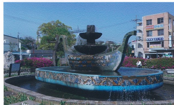
武庫之荘向上委員会 よみがえれ噴水プロジェクト