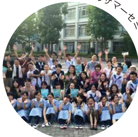
みんなのサマーセミナー