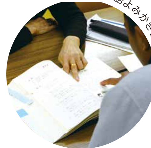
日本語よみかき教室