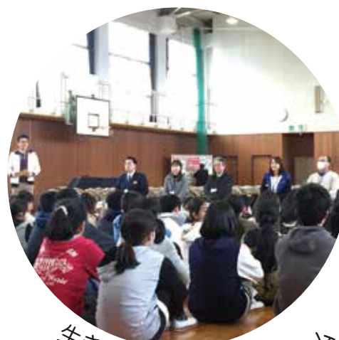
生き方探求キャリア 教育プログラム