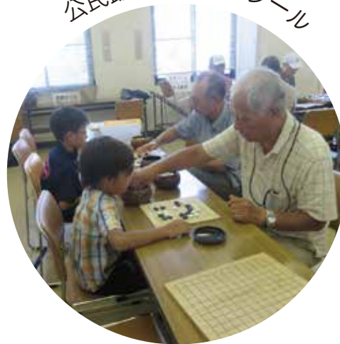
公民館オープンスクール