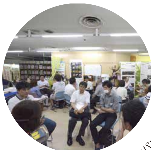
みんなの尼崎大学 オープンキャンパス