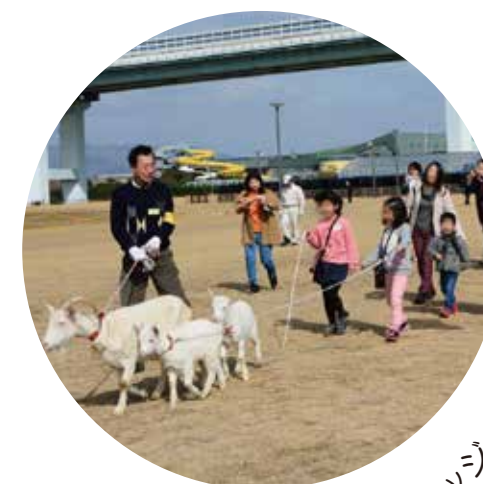
あまがさき環境 オープンカレッジ