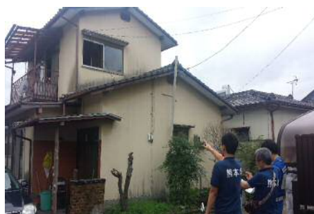
家屋被害認定等の支援活動の様子