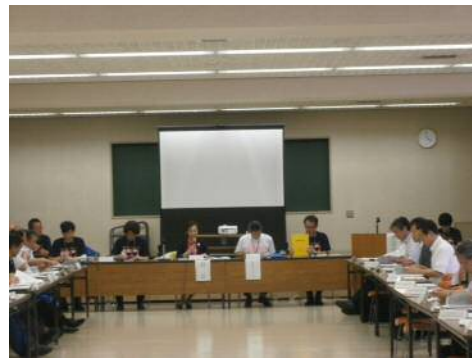
尼崎市防災会議 全景