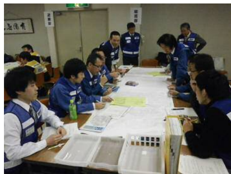
情報把握・災害対応訓練