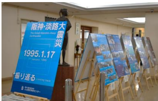
パネル展示の様子

阪神・淡路大震災により、尼崎市では、推定震度6の揺れに見舞われ、市内の死者は49名、負傷者は約7千名にのぼりました。また、築地地区をはじめ、市内では液状化が発生するなど大きな被害となりました。