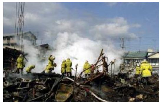
住宅火災の現場（立花）