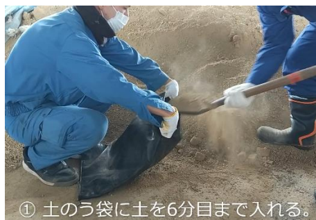
動画「土のうの作り方」

今年度は、新型コロナウイルス感染症拡大防止の観点から、資料配布と動画配信により、水防工法訓練を行い、土のうの作り方などを学びました。