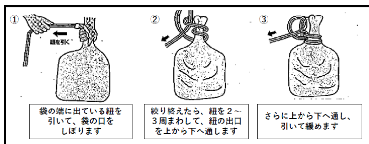
土のう袋の結び方