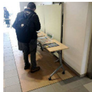
パンフレットの配布