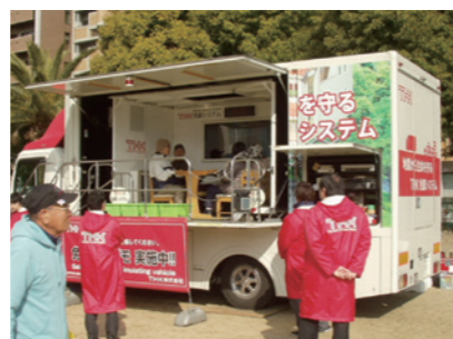
利用起震车体验地震