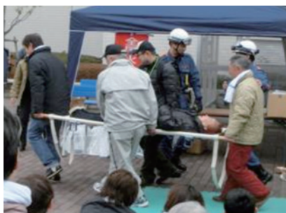
简易担架操作训练（尼崎汽艇比赛场）