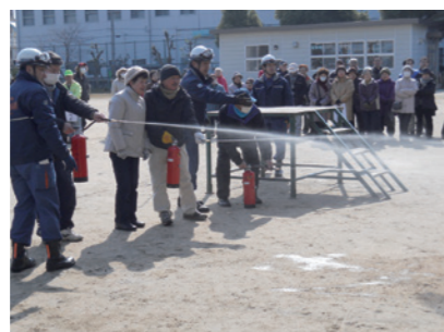
消防训练（水消防器）