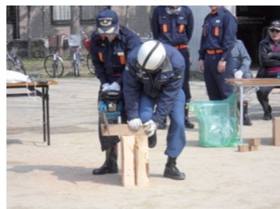
链锯操作训练（金乐寺北公园）