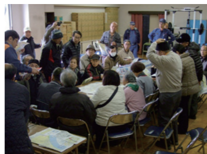
防灾进修（东消防署）