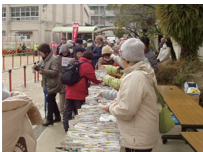
烧饭赈济灾民的训练