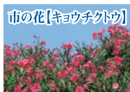
市の花【キョウチクトウ】