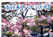
市の木【ハナミズキ】