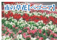
市の草花【ペゴニア】