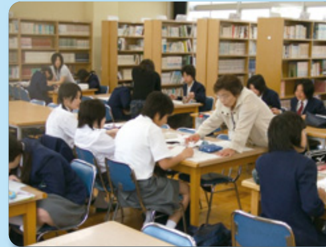
土曜チャレンジスクール (立花中学校)

発行者：尼崎市教育委員会 〒660-8501 尼崎市東七松町1-23-1 TEL. 06-6489-6727(学校教育課)