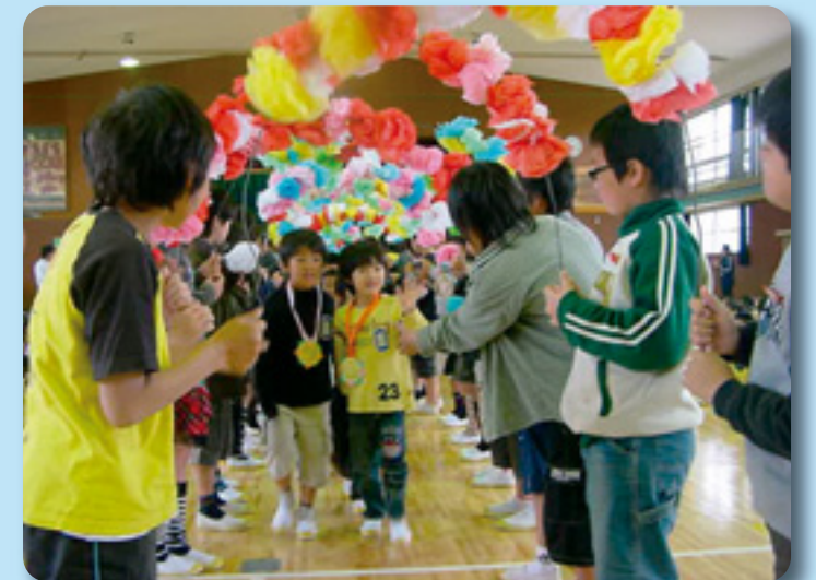
1年生を迎える会 (立花南小学校)