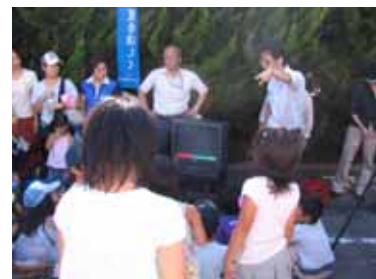
サーモグラフィーで測定

尼崎市では、市民の皆さんと市内事業者の方に二次利用水を使った打ち水を毎年呼びかいています。