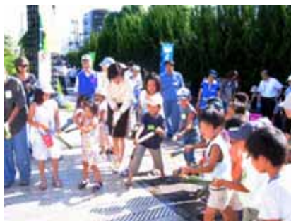
市役所本庁舎での打ち水の様子 (市長も参加しました)

7月25日(金) 市役所本庁舎西側では、クリーンセンターに溜められていた雨水を利用し、あまがさき市民環境会議と尼崎市の呼びかけで市民の皆さんが打ち水を行いました。打ち水の実施前には、「夏休み子ども環境学習」として、子どもたちは竹を使って水鉄砲を作り、その後、自分で作った水鉄砲で打ち水に参加しました。