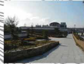
落ち着いた城址公園

③城址公園周辺整備 城址公園、中央図書館、歴史博物館用地一帯は、まとまりある公共的なエリアとして、城内地区の玄関口にふさわしい空間整備を図る。