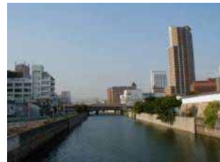
開明橋からの眺望