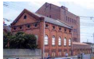
旧阪神電鉄発電所

課題 歴史文化ゾーンを中心として本市の魅力向上と地域活性化への貢献 地域資源を活かしたまちづくりの推進 市民活動の促進 城址公園周辺計画の対応