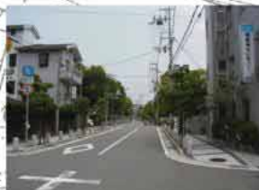
東町開明線の潤いある景観

②東町開明線の整備 寺町から大物に至る歴史文化ゾーンを東西に連絡する「地域軸」として整備する。 通過交通対策にも配慮した安全快適な歩行者空間、緑豊かなゆとりある歩行者空間を形成する。旧城内中学校敷地に面する部分は都市計画道路と一体的な遊歩道を整備する。