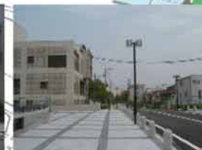
落ち着いた質の高い沿道景観

①(仮称) 歴史文化センターの整備 歴史的建造物である旧城内中学校、旧尼崎警察署を地域資産として保存の上、(仮称)歴史文化センターとして再生し、本市における歴史文化の拠点を形成する。 旧城内中学校は(仮称)歴史文化センター本館に、体育館は(仮称)尼崎城発掘体験保存館に、旧尼崎警察署は(仮称)大正・昭和の想い出館に、整備する。