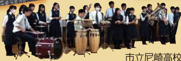
市立尼崎高校吹奏楽部

やぶくみこさん●たたいて音のなるものなら何でも楽器にしてしまう打楽器奏者で、作曲家