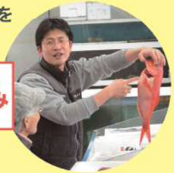
※写真は昨年イメージ