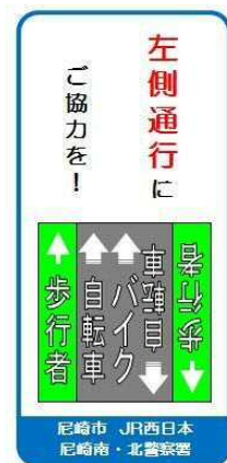
一方通行入口での案内看板