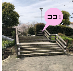
南入口の木製階段