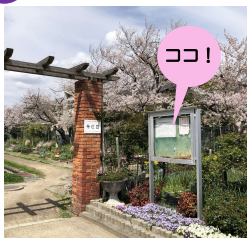
貸し花壇入口の掲示板