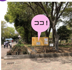
公園東入口すぐの掲示板