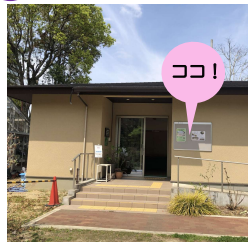
展示施設入口の掲示板