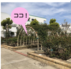
バラ園内のアーチトレリス