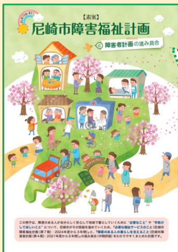
計画素案の表紙（イメージ）

尼崎市 福祉局 法人指導・障害福祉担当（部）障害福祉政策担当 電話 06-6489-6577 FAX 06-6489-6531