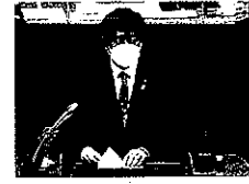
【令和4年12月13日 所信表明】

令和4年11月20日に投開票が行われ、松本氏が市民の皆様の負託を受け、27,000票余りの大差で当選されました。今回の市長選挙では、市民皆様の関心も高く、前回の市長選から8ポイント高い投票率となりました。しかしながら、近隣他都市の投票率は西宮市長選41.38%、宝塚市長選42.65%、芦屋市48.69%となっており尼崎市の課題であります。我が蒼風会では今後も市民の皆様に市政への関心を持っていただけるよう、また選挙に足を運んでいただけるよう、松本市長とは役割立場の違う観点から市民の皆様に寄り添う活動をしてまいります。