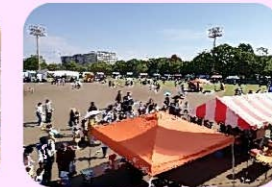
橘公園 尼崎市民まつり