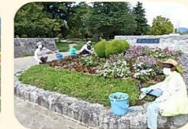
西武庫公園 花植え活動