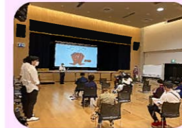
大庄地域 公園ワークショップ