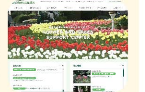
尼崎緑化公園協会HP