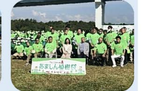
尼崎21世紀の森 地元企業と連携した活動