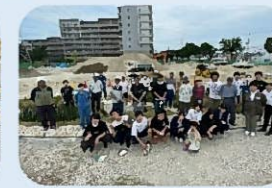
協働による雨庭づくり