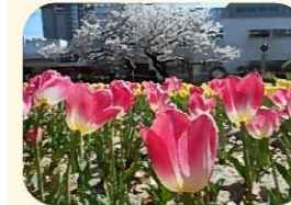
中央公園 チューリップ花壇