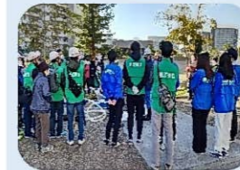
潮江緑遊公園 防災訓練