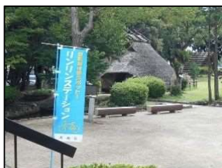
写真5 尼崎市リンリンステーション（市立田能資料館）