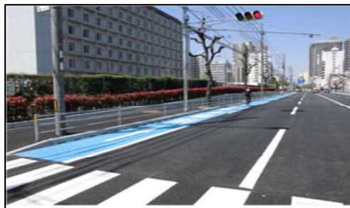
写真9 (再掲) 西川線 (自転車レーン)