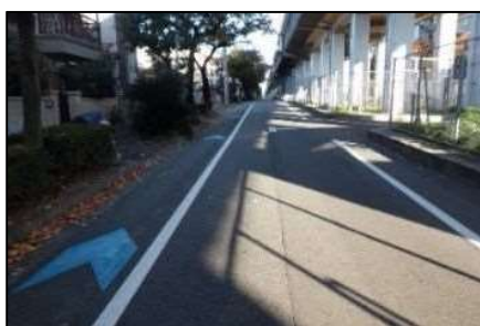
写真10 新幹線側道（矢羽根）