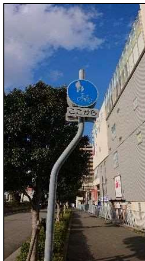
写真12 アマゴッタ付近 (自転車歩行者道)