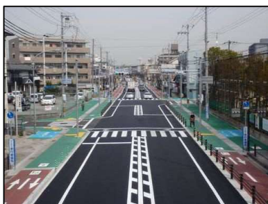
写真8 近松線（自転車道）