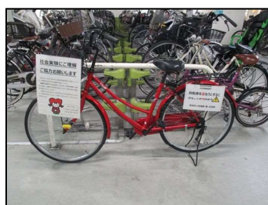
写真2 アラミー配置