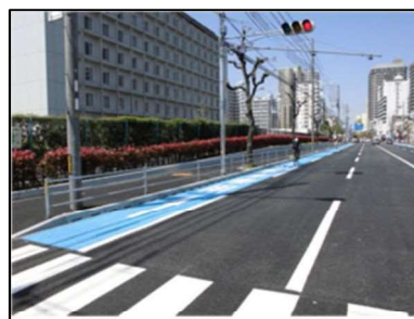
写真9 西川線（自転車レーン）