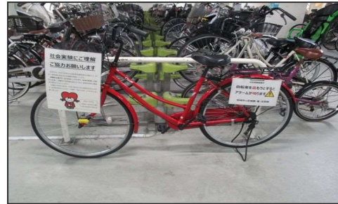
写真 2 (再掲) 自転車盗難防止の取組 (アラーム)