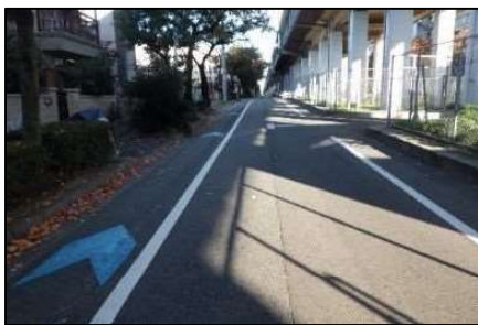
写真10 (再掲) 新幹線側道 (矢羽根)