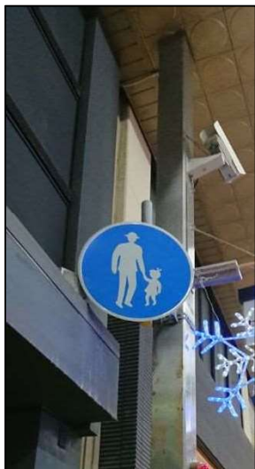
写真13 中央商店街 (歩行者専用道路)

(答え) 写真12の場所は徐行でしか通れず、写真13の場所は押し歩きしないと通れません。