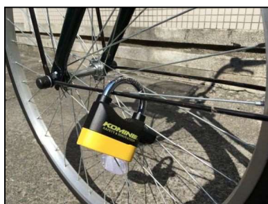
写真1 アラミーの南京錠型セキュリティロック

※5：令和2年1～7月までの実績(コロナの影響の大きかったと思われる4月及び5月を除く)から試算