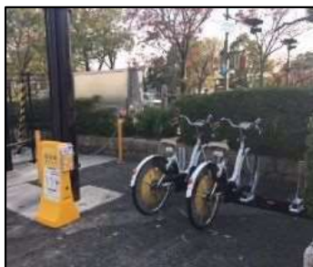
写真7 コミュニティサイクルポート（市役所本庁舎）