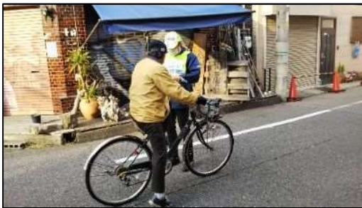
写真 14 自転車事故防止の取組 (交通安全指導)

各分野の様々な取組については、本市の自転車のまちづくりに関する周知・広報などは全市的に取り組む一方、例えば、自転車事故や盗難の防止についてはそれぞれの多発エリアで、地域経済の活性化の事業は商業地域を中心にそれぞれ行うなど、地域ごとの特色を踏まえ、重点地区を設定し、効果的な展開を狙います。