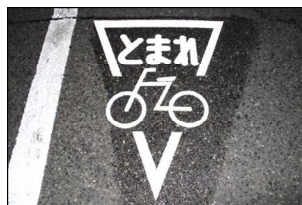
写真11 竹谷小学校区内交差点 （自転車とまれマーク）