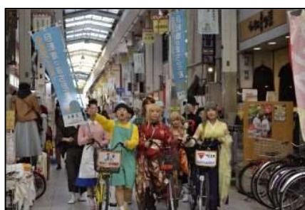
写真4 尼崎市コスプレ自転車交通安全パレード&撮影ツアーの様子