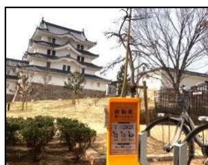
写真6 コミュニティサイクルポート（尼崎城）