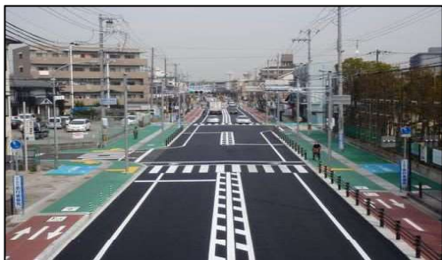
写真8 (再掲) 近松線 (自転車道)

通れる場所でも、走って通れる場所か、徐行でしか通れない場所か、押し歩きしないと通れない場所か違いは判りますでしょうか。