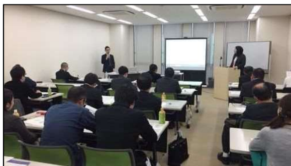
写真3 尼崎市エコ通勤セミナーの様子

二酸化炭素排出量（運輸部門） 38.1万t（R7目標） H30：39.7万t、R1：万t、R2：万t