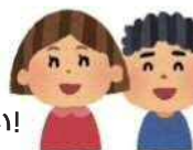
立花南小学校の子どもたち