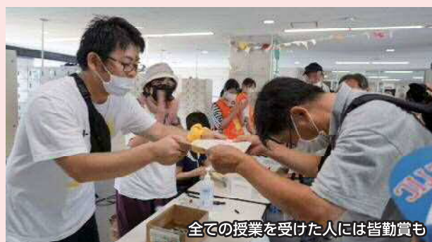
全ての授業を受けた人には皆勤賞も