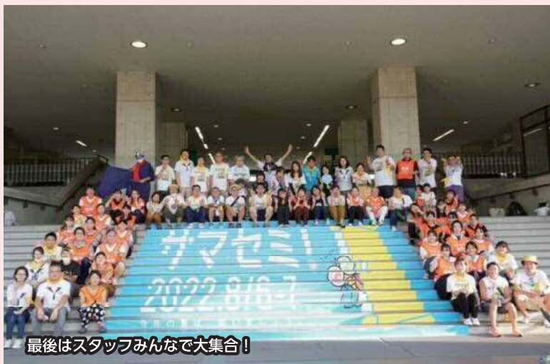
最後はスタッフみんなで大集合！