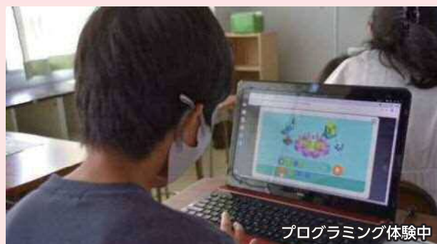
プログラミング体験中

生徒になる人にも特別なルールはありません。時間割をチェックして、好きな授業を好きなだけ受講してください。学びを生かし活躍できる場が暮らしの中にある。それを面白いと応援する人がいる。みんなのサマーセミナーはそんな場所です。