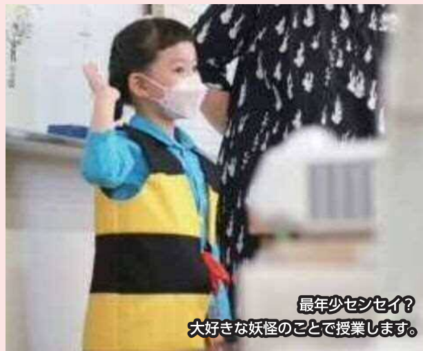
最年少センセイ？ 大好きな妖怪のことで授業します。