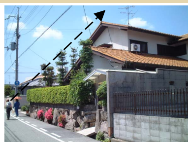
2階の外壁面を道路から後退させて上空への広がりが増しています。