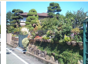
トレリスやハンギングプランターなどのガーデニング手法による見た目にやさしい修景です