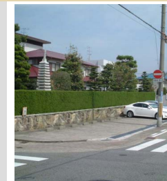
駐車場の舗装に工夫して芝生や高木植栽を施すことで、生垣とあいまってうおいのある景観が生まれます。

グリーンは七難隠すといますが、駐車場や空地の通りに面したところには、緑豊かな通り景観を途切れさせないよう、緑化を工夫していきませんか。樹木が1本でもあるとやさしい感じになります。植えるスペースが限定される場合は、プランターなどの活用も効果的です。