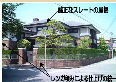
純洋館風スタイル： スレート葺き+漆喰・レンガ