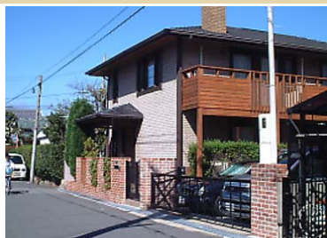
煙突のレンガや木のペランダなど建物の雰囲気にあわせた垣・柵のデザインが整った外観にしています。

特にカーポートはエクステリアの重要な要素で、床の舗装や上屋、扉などに調和を乱さないような配慮がもとめられます。