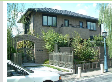
川沿いに積極的に緑化をしたり、ベランダや窓など建物の表情を水辺に向けています。

水路沿いは地区のシンボルとなる道路です。川べりの柳並木や小橋、街灯、舗道などが際立たせる水辺の風情を生かしながら、水辺に顔を向けた表情豊かな建物で、うおいのあるまち通り景観を形成したいものです。