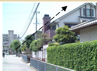
道路側に屋根の傾斜をとると道路への圧迫感を軽減でき、上空への広がりが増します。

道路側が低くなるように屋根勾配をとったり、上の階に行くほど道路から引っ込んでいるほうが圧迫感をやわらげ、天空への広がりが増すことができます。また、樹木の生育空間を大きくすることもできます。