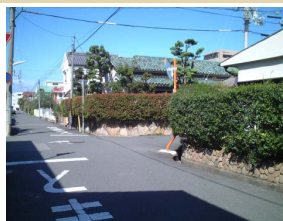
多様な樹種が植えられた生垣は緑豊かなまちなみの演出を行う方法としては効果的です。

手入れされた生垣が連なる風景は武庫之荘の特徴で、そばを通るとほっとするし、環境にもやさしいものです。生垣や、塀の外側に緑を植えたり、透視性のフェンスで庭の緑を見せるなど、バラエティに富んだ家々を緑のリボンでつなげることで、心地よい通り空間になるのではないのでしょうか。