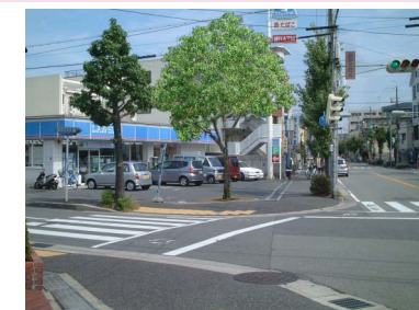
1本のシンボルツリーでまちの玄関を個性的に演出することができます。