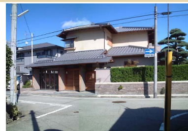
玄関棟と母屋の意匠をあわせて一体的にデザインすることで端整な外観となっています。