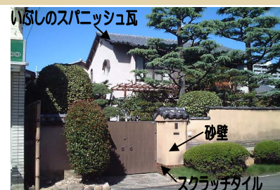
折衷洋館風スタイル： 黒スパニッシュ瓦葺き+砂壁

*地区計画にもとづき、尼崎市では建築物等の外壁色彩の指導基準を設けています。(裏表紙参照)