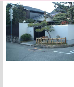
和風・洋風の入り口のしつらえでまちかどを印象的に演出することができます。

道路が出会うまちかどは視線が切り替わり開ける印象的な場所です。主要な幹線道路の交差点をはじめ、角地の建物やエクステリアに創意工夫を行なうことで、印象的なまちかどとし、まちの個性を高めませんか。