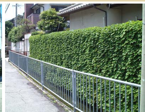
無粋なブロック塀もツタやツル性の植栽を組み合わせることで緑豊かな景観にできます。