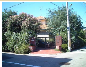
開放的な緑化によって庭の樹木も緑豊かなまちなみ景観の演出に寄与しています。