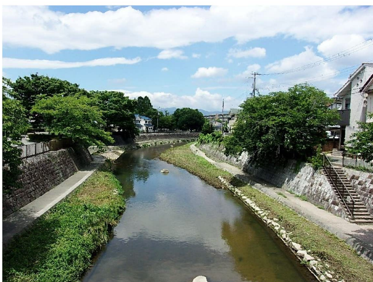
かみいくしまばしふきん 上生嶋橋付近