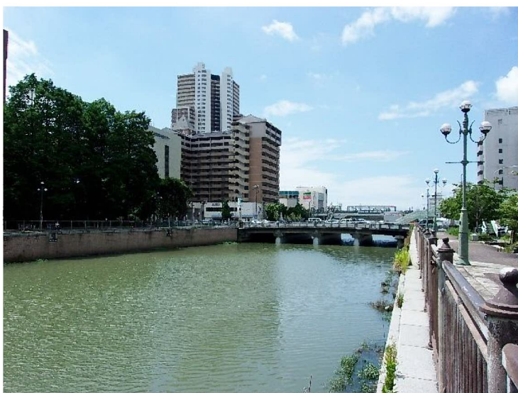
たまえばしふきん 玉江橋付近