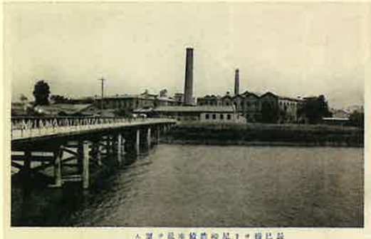
▲尼紡本社絵葉書「辰巳橋ヨリニ崎紡績本社ヲ望ム」

江戸時代は城下町として栄えた尼崎でしたが、幕末・維新时期には町は疲弊し経済は停滞していました。このような状況を打破し尼崎の町に再び繁栄を取り戻すため、尼崎の商人や旧尼崎藩士らは、綿糸紡績の大工場を尼崎に設立することを考えました。しかし、尼崎の資本力だけでは大工場設立は不可能でしたので、大阪財界を頼ることとし、両者の共同出資により、明治22年(1889)尼崎紡績会社が設立されました。尼崎紡績は尼崎町のうち辰巳町(現在の尼崎市東本町)に煉瓦造2階建の大工場を建設し、明治24年(1891)に操業を開始しました。これは兵庫県下では初の1万錘規模の大紡績工場でした。