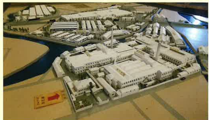
▲大日本紡績ニ崎工場模型