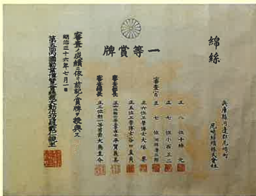
▲第五回内国勧業博覧会一等賞牌

ニ崎紡績は、技術的に困難とされた細番手・中番手の綿糸生産に主力を注ぎ、他社を合併しながら企業規模を拡大していきました。そして、大正7年(1918)には摂津紡績を合併して社名を大日本紡績と改め、日本最大の紡績会社へと発展していきました。また、このニ崎紡績の成功が契機となり、ニ崎南部で工業が発展していくことになりました。