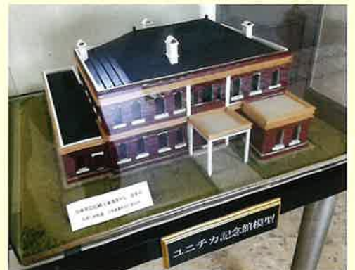
▲ユニチカ記念館模型