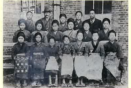
▲鹿児島から初めて来た女性工員たち