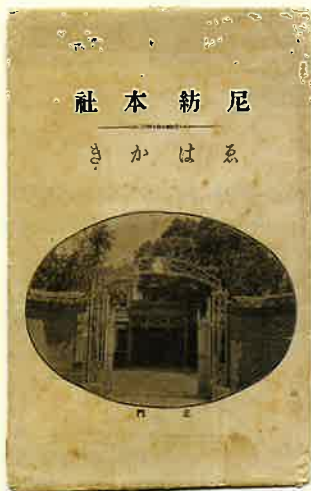
▲ニ紡本社絵葉書タウトウ (大正初期頃の本社事務所が奥に見える)

ニ崎紡績では、明治32年(1899)、ニ崎本社工場内に本社事務所を新築することを決定し、翌年、煉瓦造2階建の本社事務所が竣工しました。昭和20年(1945)の空襲でニ崎工場は大被害を受け、ニ崎での綿糸生産は事実上終止符を打ちましたが、旧ニ崎紡績本社事務所(旧事務所)は戦災を免れ、昭和34年(1959)から日紡記念館(後にユニチカ記念館)として一般公開されました。旧事務所は、現存するニ崎市内最古の洋風建築物であり、ニ崎紡績に関して市内に現存している唯一の建築物です。いわば、工業都市ニ崎の歩みを象徴するシンボルともいえるべき建築物ですので、令和5年(2023)3月、ニ崎市が旧事務所を取得し、市民共有の歴史遺産として保存・活用していくことになりました。