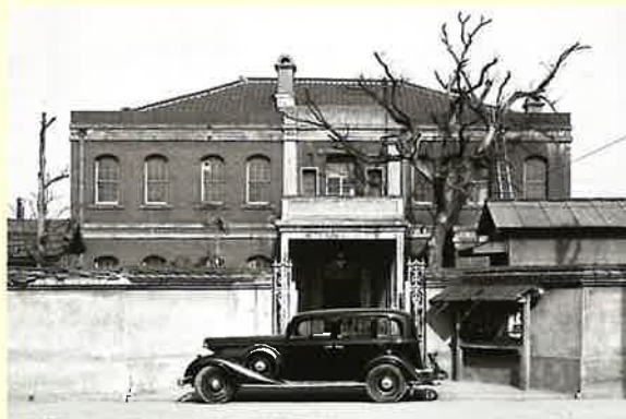
▲昭和30年頃の旧事務所