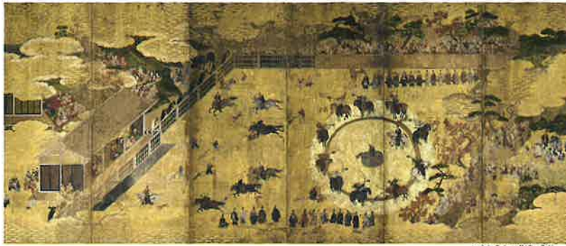
いぬおもうものずびょうぶ 犬追物図屏風