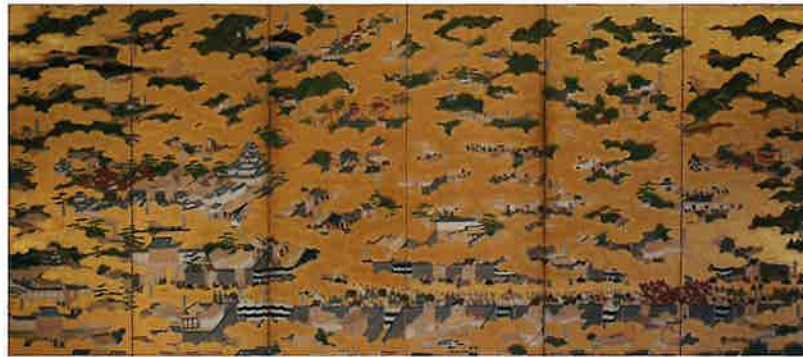
らくちゅうらくがいずびょうぶ 洛中洛外図屏風 (左隻)