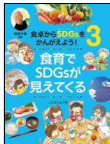
「食卓から SDGsをかんがえよう! 3 食育でSDGsが 見えてくる」 こどもくらぶ/編 (岩崎書店)