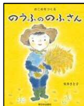
「おこめをつくる のうぶののぶさん」 室井 さと子/文 (新日本出版社)