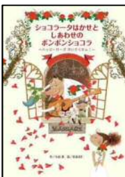
「ショコラータはかせと しあわせの ボンボンショコラ」 小山 進/文 (フレーベル館)