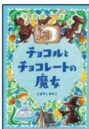
「チョコリと チョコレートの魔女」 こばやし ゆかこ/文 (岩崎書店)