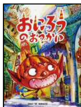
「おにろうのおつかい」 尾崎 玄一郎/文 尾崎 由紀菜/文 (楷成社)