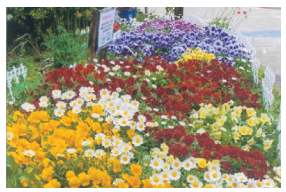
昨年度のコミュニティ緑化部門で入賞した花壇

フラワーガーデニングコンテストの▷家庭緑化▷コミュニティ緑化▷学校緑化——部門に出品する花壇を募集します。☎市内在住か在勤の個人や団体が市内の一般に公開された場所に造っている花壇(学校緑化部門は敷地内可) 申 11月30日(必着)までに所定の用紙と昨年12月以降に撮影した写真5~7点(全体写真と見どころ写真、各3MB以下)を直接か郵送、Eメールで上坂部西公園緑の相談所。 入賞作品は、来年春に同公園の展示施設で開催予定の写真展でパネル展示します。 昨年度のコミュニティ緑化部門で入賞した花壇