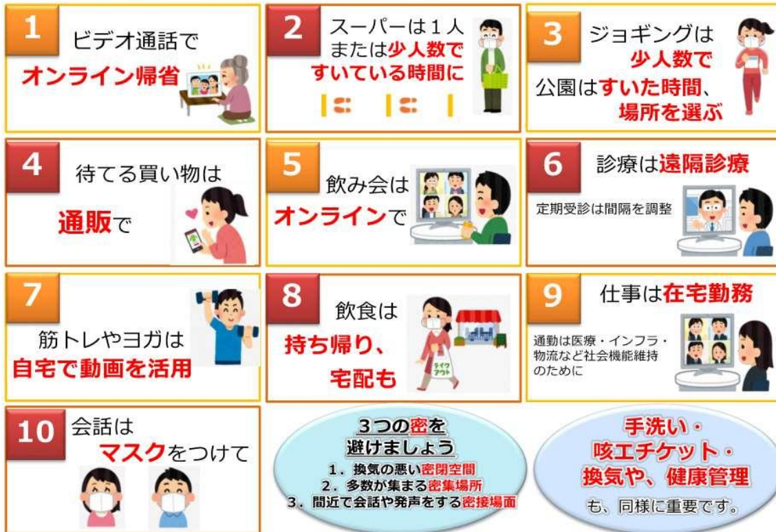
図1 人との接触を8割減らす、10のポイント

緊急事態宣言の中、誰もが感染するリスク、誰でも感染させるリスクがあります。 新型コロナウイルス感染症から、あなたと身近な人の命を守るよう、日常生活を見直してみましょう。