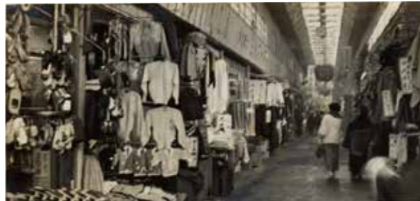
昭和30年(1955)の新三和商店街

新三和商店街は衣料品屋さんがひしめき合っていたそうです。現在の西川呉服さんがある場所に、かつては尼信さんの支店もあったそうです。