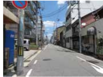
現在の西本町8丁目

明治38年(1905)にできた出屋敷駅。当時は、中国街道が今の西本町7丁目、8丁目あたりを通過していて、商店がたくさん並び栄えていたので、この辺りに駅が作られました。最初は1両で走っていた電車ですが、編成が長くなるに従って、ホームが足りなくなり、芋畑で整備しやすかった現在の場所へ移ったと思われます。大正9年(1920)の地図を見ると、出屋敷駅は現在の位置に描かれていました。