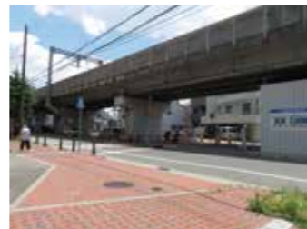
出屋敷駅があったと思われる場所(西本町7丁目271付近)