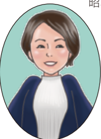
竹谷小学校区担当 くきの

出屋敷線から阪神本線に向かって東西に細い道が走っていますが、かつてここは中通り商店街で、靴屋さんばかりが並んでいたそうです。昭和34年(1959)の地図を見ても確かに靴屋だらけ！お客さんの取り合いの喧嘩が絶えなかったそう…。