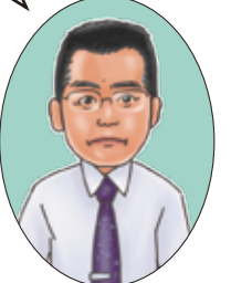
難波小学校区担当 きのした

上記の写真で、三角公園北東の道路の延長線上に総合医療センター南交差点北西の斜め道路に繋がっていることがわかるかと思います。