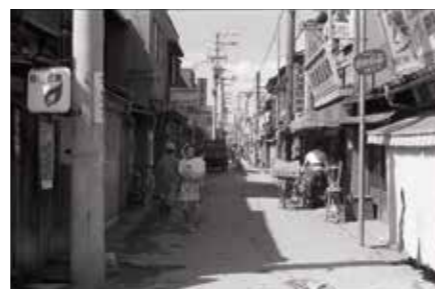
昭和39年(1964)の南竹谷町1丁目の様子

阪神本線の南の通りには新道商店街があり、こどもとても賑わっていたそうです！小さい頃は、おつかいと言えばこのあたりに行って、お醤油などを買っていたとのこと。お話を聞かせていただいて、出屋敷のあたりは買い物に困らないエリアだったんだと改めて感じました。