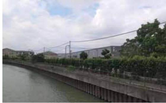
建設予定地だった現扶桑町

昨年3月27日に実施した「中央ぶらぶらウォークラリー」に参加された方は記憶に残っているかもしれませんが、実は現扶桑町（旧北難波町）は国技館建設予定地だったのです！