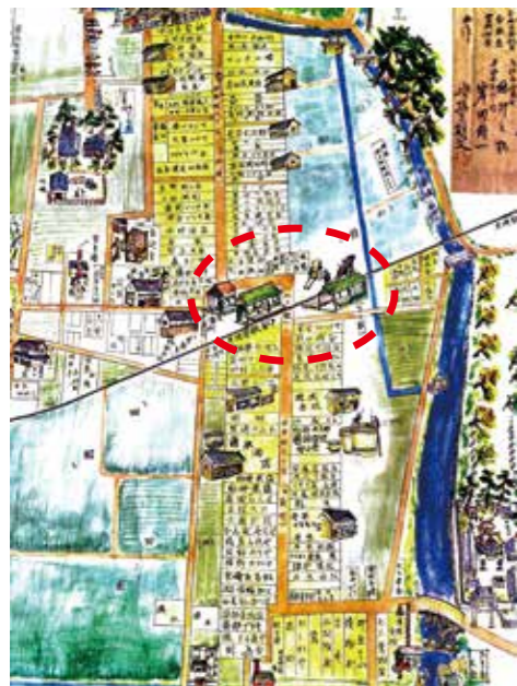
竹谷新田村及び出屋敷絵図（一部）

現在の琴浦通りから南側エリアの明治末期から大正5年(1916)までの様子を描いた「竹谷新田村及び出屋敷絵図」(昭和54年-1979-作成・歴史博物館蔵)から見える、昔と今を比べてみました！