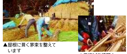
▲屋根に葺く茅束を整えています