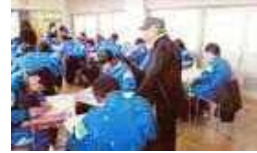
◀出張学習会のお手伝いの様子

田能遺跡サポーター養成講座 4月、5月実施 対象:18歳以上 場所:田能資料館 費用:無料 田能資料館 TEL:6492-1777