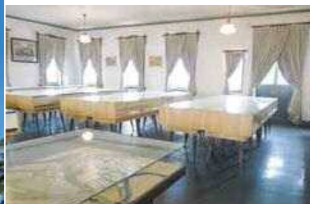
▲2階展示室 2階展示室では、尼崎紡績の創業からニチボー、ユニチカに至る歴史に関する貴重な資料を展示しています。