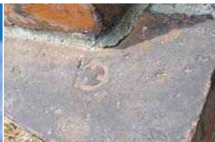
▲国内煉瓦メーカーの刻印がある煉瓦 記念館の外壁煉瓦はイギリス製と言われてきましたが、大阪窯業や堺煉瓦など国内煉瓦メーカーの刻印が確認できます。写真は大阪窯業の刻印。