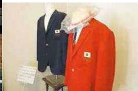
▲女子バレーボールチームゆかりの資料 2階展示室には東京オリンピックで金メダルに輝いた女子バレーボールチームに関する資料を展示しています。写真は大松監督着用のブレザー。

大人も子どもも どこでだって学べる。 まちじゅう学び場。 「あまナビ」は あなたの学びを 応援します。