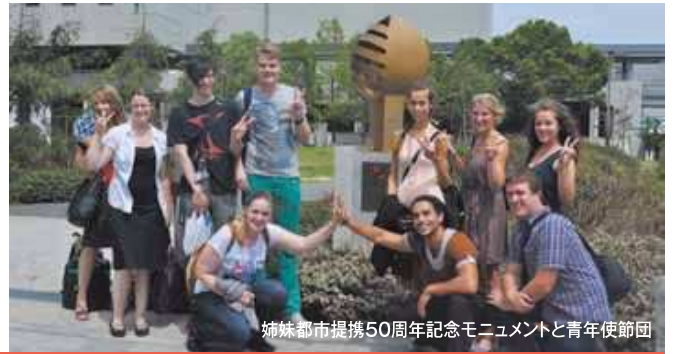
姉妹都市提携50周年記念モニュメントと青年使節団