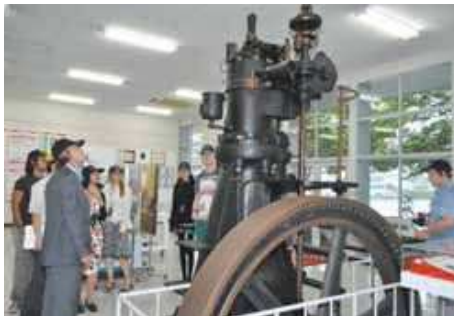
青年使節団のヤンマー見学の様子