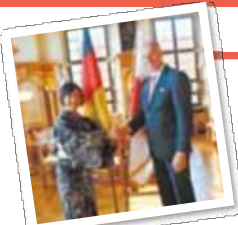
アウクスブルク市長と 尼崎市長

尼崎市は、ドイツのアウクスブルク市と姉妹都市提携を結んでおります。昭和34(1959)年4月7日、日本とドイツの間で最初の姉妹都市提携が結ばれました。