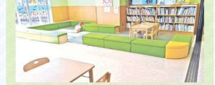
園田東生涯学習プラザにコミュニティスペースがあります!