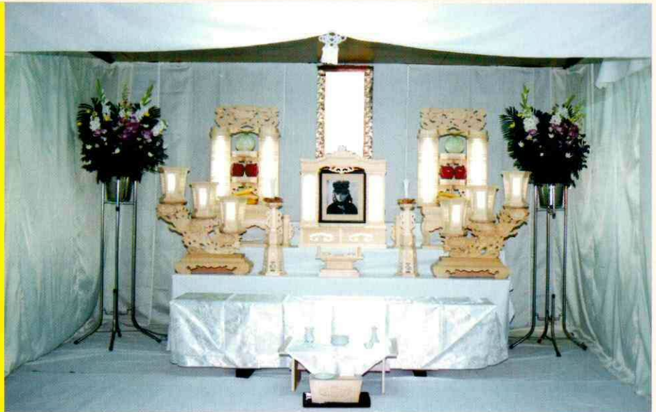
月パック 二段飾り