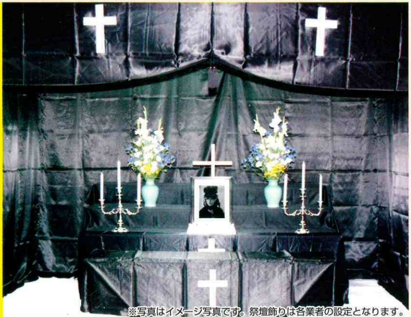
※写真はイメージ写真です。祭壇飾りは各業者の設定となります。