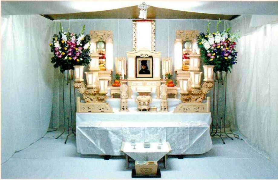
雪パック 三段飾り