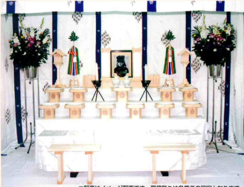
※写真はイメージ写真です。祭壇飾りは各業者の設定となります。