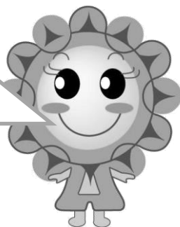
社協キャラクター あまりん